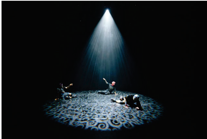
Figure 3: 7 Solos for Bacteria Falling Through