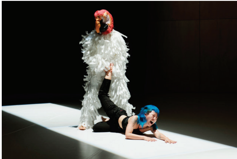
Figure 4: Glitch.

The Western cultural technique of documentation is what comes before this experience; the document is the technological apparatus that concerns the liberal nation-state and serves to maintain its structures. This writing tries to complexify the relations between my artistic practice and the invisible macro-structures of power like the document (proof of existence) with a shrill scream, a knot in the neck, deep anguish, and a sinking melancholy. Most cultural institutions reproduce inequalities of social, gender, race, and class, mainly as a way to maintain power; in this particular case: those created by the choreographic shifts from south to north, the colonial reproduction of captivity, of the archive, of categorization. With a cold analytic procedure—capturing in vitro, dead or alive—all urgent life forms are framed in neat terms such as internationalization, inclusion, and diversity.