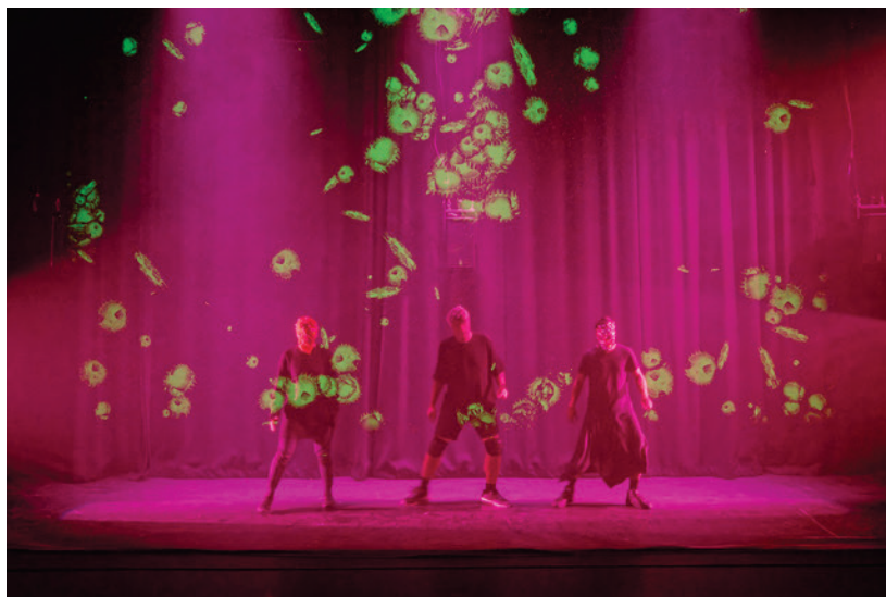
Figure 5: 7 Solos for 11 Bacterias Falling Through

For a bacteria from a highly contagious context from the south; trans-dislocated and relocated in this in vitro experiment called "reality," the available options would be immediate death or a shapeshifting survival mode transmuted in rhythm, speed, sharpness, precision in a radical choreography. The bacteria together can also change the environment. I was immersed in a petri dish, a test tube in this realm; and all my movements, thoughts, desires, and companion species disappeared, and vanished away. I forgot everything. I was under control and surveillance by the "real scientists" who were naming, describing, cataloging, commenting, wording, categorizing, understanding, reading, listening, analyzing, and criticizing.