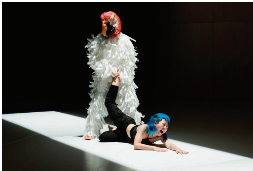
Figure 1: Glitch

- João Do Vale e José Cândido, "Carcará"